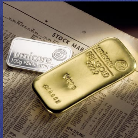
Der Erwerb von Umicore-Feingoldbarren ist mehrwertsteuerfrei.